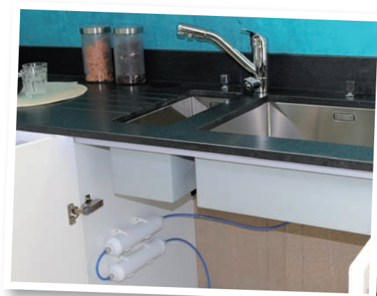
Purificateur 2 filtres avec robinet 3 voies (option)