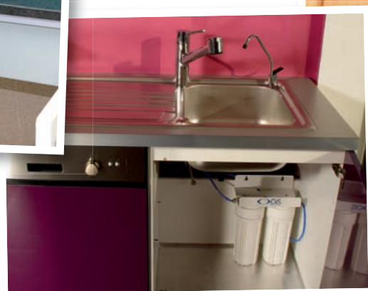
Fontaine 2 filtres